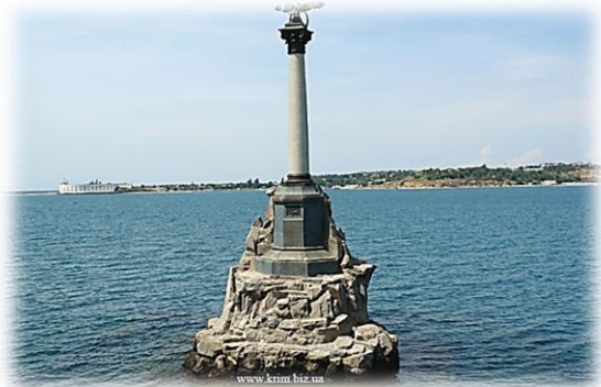
Севастополь – 2013. Пам'ятник затопленим кораблям

Конференція відбудеться у Севастопольському інституті банківської справи Української академії банківської справи Національного банку України, що розташований у мальовничому куточку Севастополя поблизу Парку Перемоги на узбережжі Чорного моря