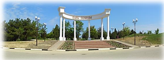
Севастополь – 2013. Парк Перемоги