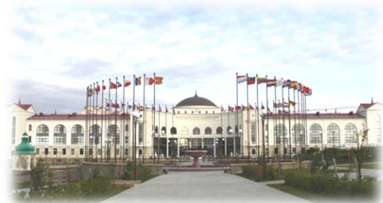
Севастополь – 2013. Севастопольський інститут банківської справи Української академії банківської справи Національного банку України