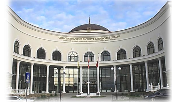
Севастопольський інститут банківської справи Української академії банківської справи Національного банку України