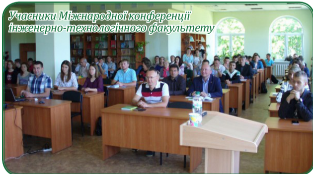
Учасники Міжнародної конференції інженерно-технологічного факультету

захстану та Польщі. Предметом обговорення учасників конференції стали актуальні питання розвитку логістичних систем. Особлива увага присутніх була зосереджена на зовнішньоекономічних аспектах розвитку