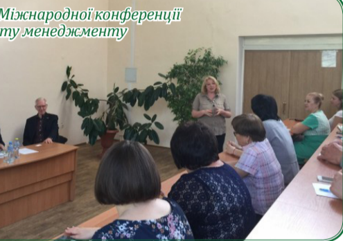
Учасники Міжнародної конференції факультету менеджменту

18-19 травня Міжнародна науково-практична конференція «Міжрегіональна взаємодія логістичних систем в умовах трансформації економіки» відбулася на факультеті менеджменту. У роботі наукового заходу взяли участь як вітчизняні науковці, так і вчені з університетів США, Білорусі, Ка-