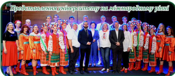
Представлення університету на міжнародному рівні

Життя активної і талановитої молоді університету вирує, як сама весна, постійно народжуючи нові творчі ідеї і культурно-мистецькі проекти.