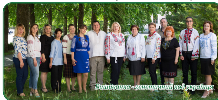
Вишиванка – генетичний код українця

Наступним етапом проекту стало проведення пригодницького квесту «Стеж-