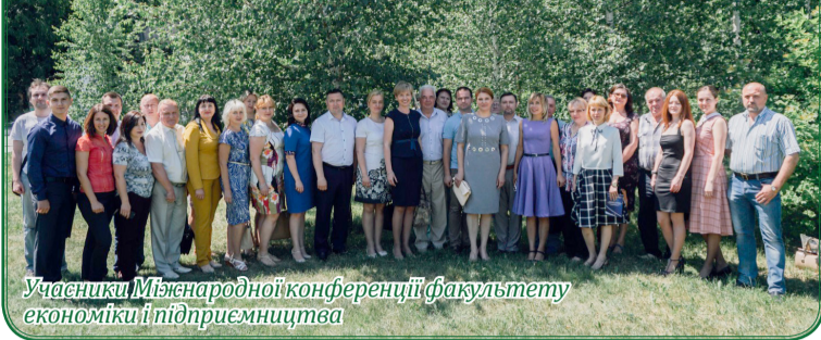
Учасники Міжнародної конференції факультету економіки і підприємництва

Травень в Уманському національному університеті садівництва видався багатим на важливі наукові заходи.