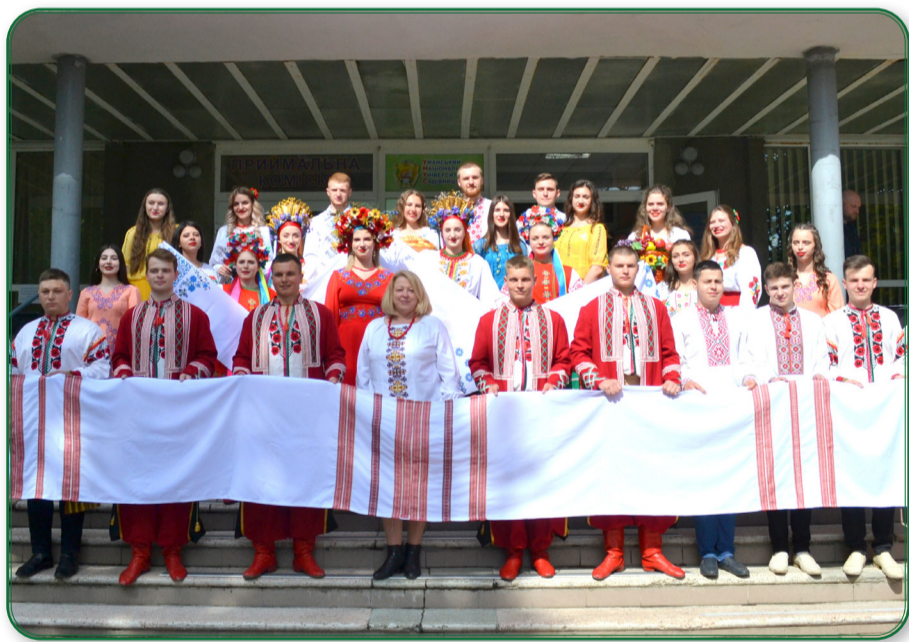
15-й день вишиванки, малий ювілей ідентичності молоді держави, Уманський національний університет садівництва святкував усім колективом, разом зі всією Україною та світом.

кував усім колективом, разом зі всією Україною та світом.