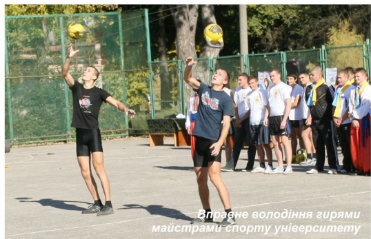
Вправне володіння гирями майстрами спорту університету