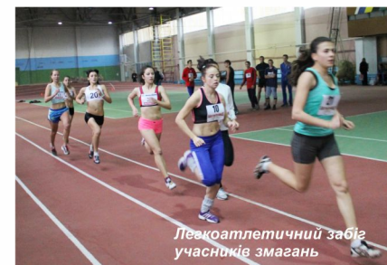
Легкоатлетичний забіг учасників змагань

Дівчата змагались на дистанції 1000 м. Команду було нагороджено дипломом комітету з фізичного виховання та спорту Черкаського обласного відділення.