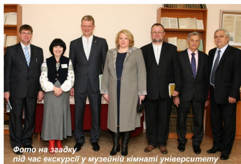
Фото на згадку під час екскурсії у музейній кімнаті університету

У виступі Міністра аграрної політики та продовольства України Ігоря Швайки на зустрічі з присутнім студентством прозвучали актуальні питання: можливість інвестування людського капіталу в аграрний сектор України; врахування потреб та сучасних вимог роботодавців до майбутніх працівників; збереження аграрної освіти в системі галузі освіти.