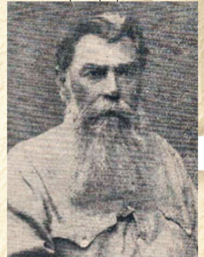
Наливаючи у бокал кримське вино, згадайте Сергія Федоровича Охременка.