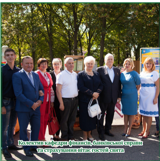
Колектив кафедри фінансів, банківської справи та страхування вітає гостей свята