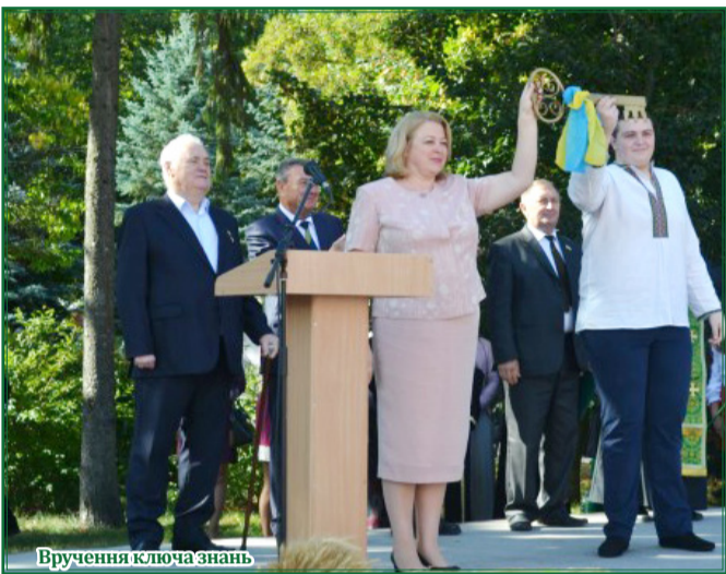
Вручення ключа знань

ЗАСНОВНИКИ. РЕКТОРАТ ТА КОЛЕКТИВ УМАНСЬКОГО НАЦІОНАЛЬНОГО УНІВЕРСИТЕТУ САДІВНИЦТВА № (859) ЧЕТВЕР 14 ВЕРЕСНЯ 2017 р. Виходить із 1957 р. Безкоштовно