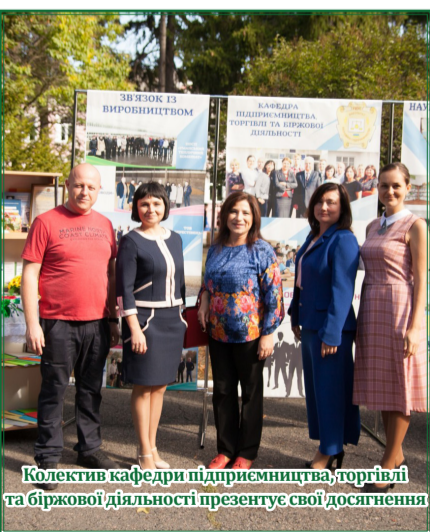
Колектив кафедри підприємництва, торгівлі та біржової діяльності презентує свої досягнення