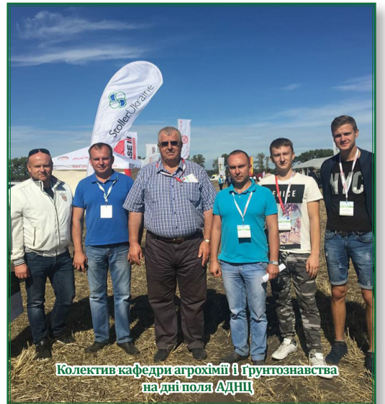
Колектив кафедри агрохімії і ґрунтознавства на дні поля АДНЦ