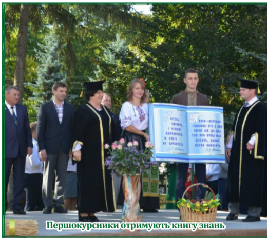
Першокурсники отримують книгу знань