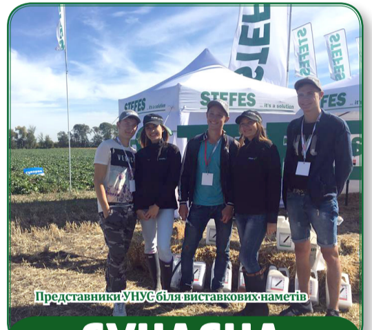
Представники УНУС біля виставкових наметів

Програмою проведення Дня Університету передбачені цікаві аспекти з життя навчального закладу, з яких можна зробити висновки про невідмінну працю колективу навчального закладу. Створюється невід-