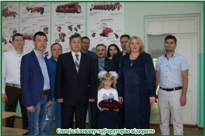
Спеціалізовану лабораторію відкрито

Тепер студенти мають гарну наочність для проведення лабораторних робіт, здійснювати курсові та дипломні проєктування, що є важливим кроком у підготовці майбутніх фахівців.