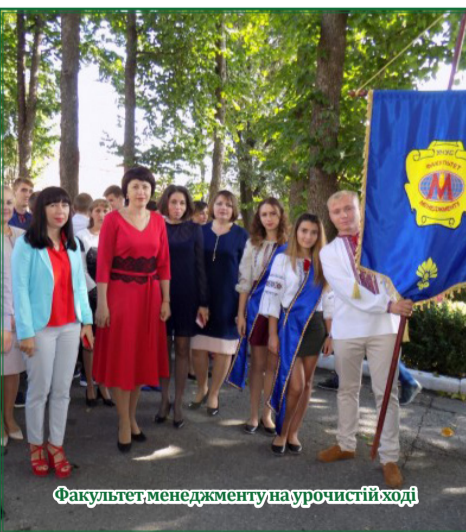
Факультет менеджменту на урочистій ході

робне враження єдиної родини, яка розвиває свої традиції та наукові здобутки, досягає успіхів, пишається своїми вихованцями. Авторитетні викладачі сповнені гордості за своїх випускників, які теж присутні на святі. Маючи за плечима певний досвід та гарні досягнення в науково-практичних сферах, вони закликають студентів до лану працелюбства та здорового ентузіазму до наук.