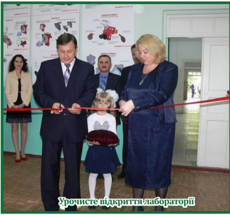
Урочисте відкриття лабораторії

Новий навчальний рік розпочався для викладачів і студентів Уманського НУС приємним подарунком, адже саме першого вересня цього року кафедра процесів, машин та обладнання АПВ впише в історію сторінок нашого навчального закладу як дату відкриття спеціалізованої лабораторії ґрунтообробних та посівних машин, обладнаної за сприяння публічного акціонерного товариства «Ельворті».