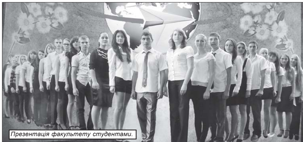
Презентація факультету студентами.