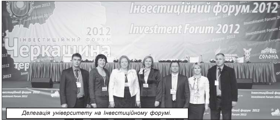
Делегація університету на Інвестиційному форумі.