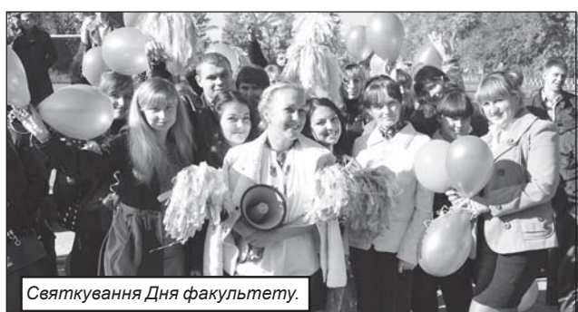
Святкування Дня факультету.

нальної спілки майстрів народного мистецтва України, заслуженим майстром народної творчості України.