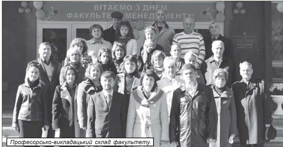
Професорсько-викладацький склад факультету.