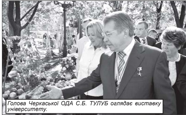
Голова Черкаської ОДА С.Б. ТУЛУБ оглядає виставку університету.

Аграрну спрямованість навчального закладу підкреслили кафедри факультетів агрономії і плодоовочівництва, екології та захисту рослин. Послідовне розміщення кафедр наглядно демонструвало технології вирощування основних сільгоспкультур, плодів та