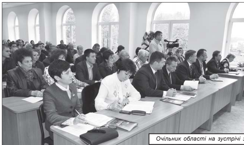
Очільник області на зустрічі з колективом університету.